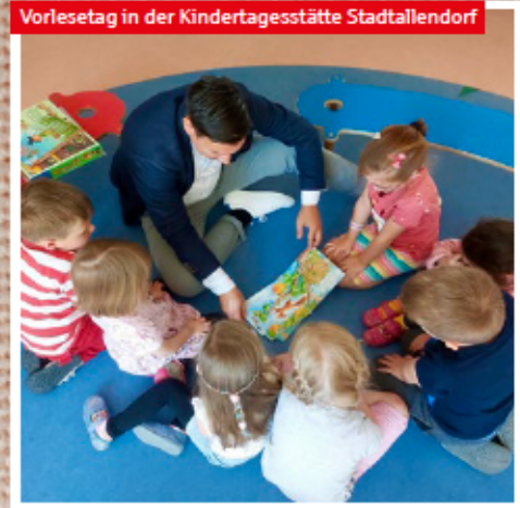
Vorlesetag in der Kindertagesstätte Stadtlendorf