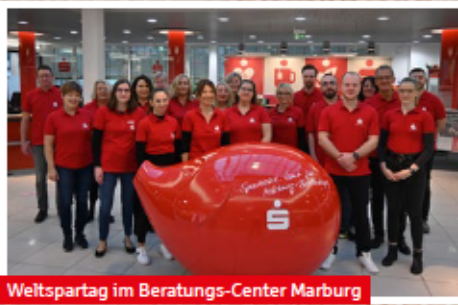
Weitspartag im Beratungs-Center Marburg