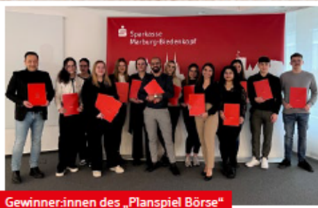
Gewinner:innen des „Planspiel Börse“