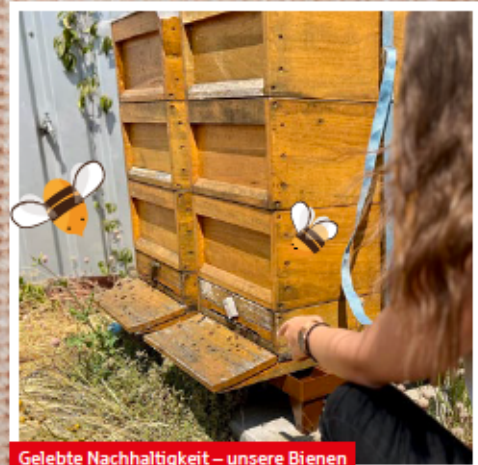
Gelebte Nachhaltigkeit – unsere Bienen