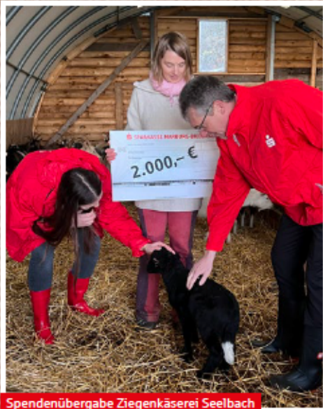
Spendenübergabe Ziegenkäserei Seelbach