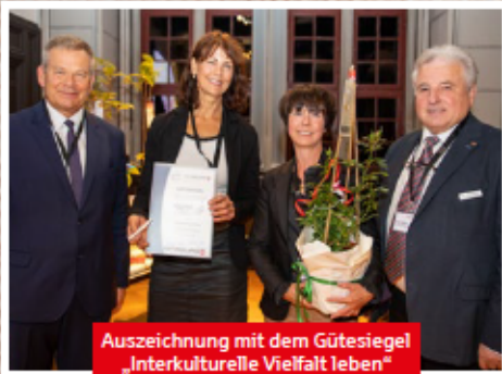
Auszeichnung mit dem Gütesiegel „Interkulturelle Vielfalt leben“